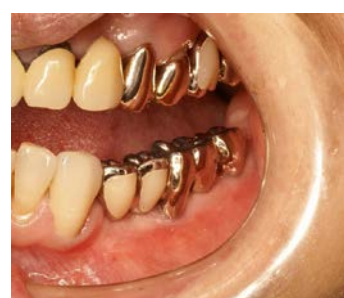
かぶせ物をつけた後