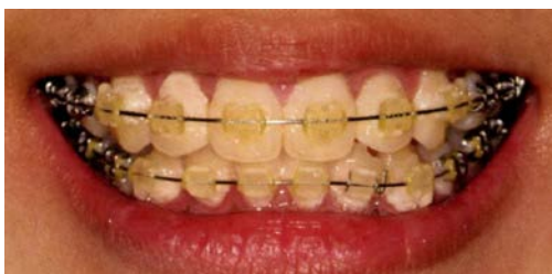
従来からの矯正装置

欠点にも書きましたが全ての症例に適応している訳ではありませんので、矯正治療を考えている方は、ぜひ一度当院までご相談ください。