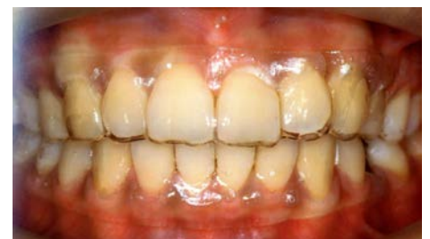
目立たない矯正装置