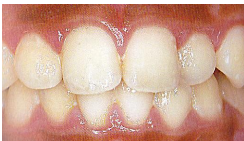
きれいに見える口腔内

プラークは時間が経つにつれ歯ブラシで軽くこすっても取れにくい硬いものに変化していき、表面には柔らかい状態のままです。そこに染色剤を塗布すると色素が軟らかな表面から硬い内部へと浸透し、プラークを構成しているタンパク質や多糖類と結合します。歯や歯肉には色素は浸透しないためプラークだけが染め出されます。