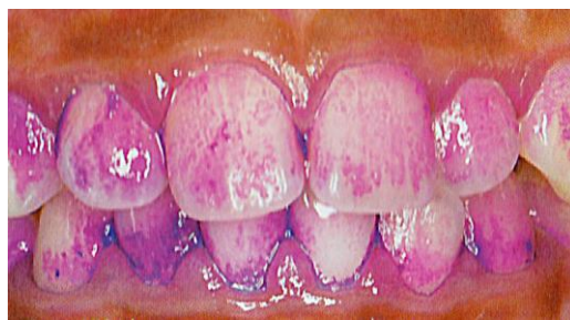
汚れの部分が染色される

染色剤には食用色素が使われており、赤色はフロキシシン、青色はブリリアントブルーがおもに使われています。ブリリアントブルーはフロキシシンに比べて拡散しやすい性質のため、柔らかいプラークからは流れ出て残ったフロキシシンによって新しい表面のプラークが赤く染まります。そしてブリリアントブルーは古くなったプラークに浸透して青色に染め出します。