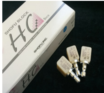
ブロックをセット