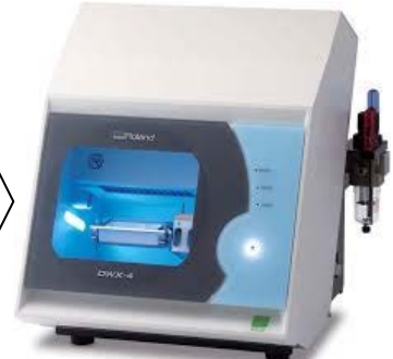
設計を基に削り出す