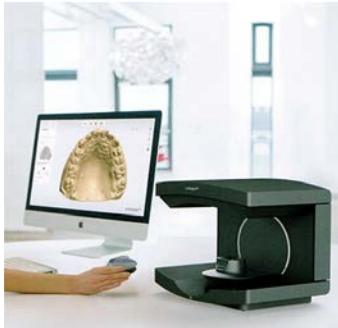
模型を読み込んで設計

別の機械でブロックを設計どおりに削り出します。すべて機械で出来るなんて、歯科補綴のハイテク化を感じます。今月末にはカウンセリングルームに設置予定ですので、目にしていただけるとと思いますのでよろしくお願いします。