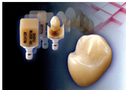
削り出し、研磨、完成