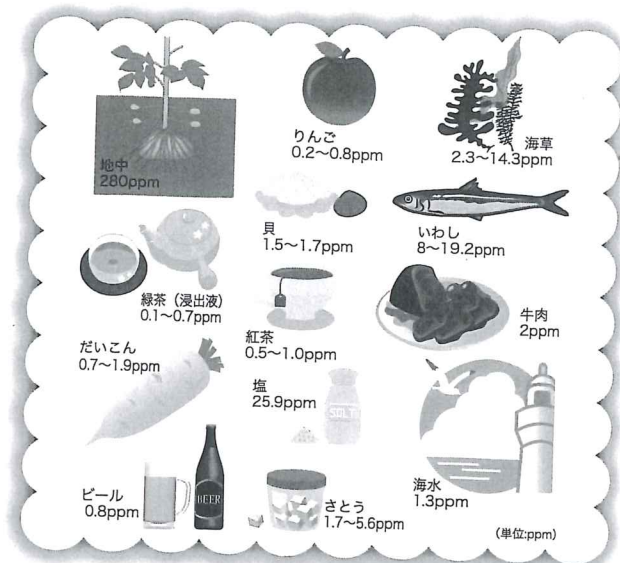
ppmとは100万分の1の含有率(量)という単位です。水1リットル中に1mg含まれていれば、1ppmです。